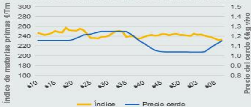
Evolución semanal durante los últimos 12 meses