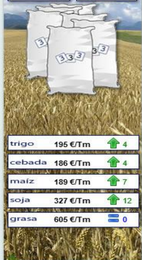
Evolución semanal durante los últimos 12 meses