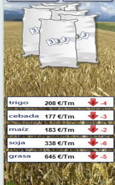
Evolución semanal durante los últimos 12 meses