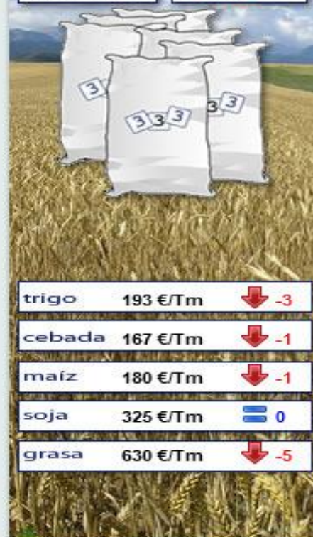
Evolución semanal durante los últimos 12 meses