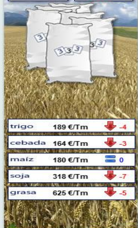
Evolución semanal durante los últimos 12 meses