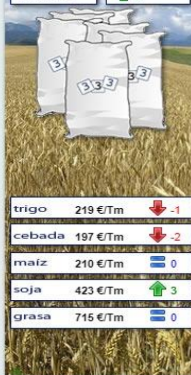
Evolución semanal durante los últimos 12 meses