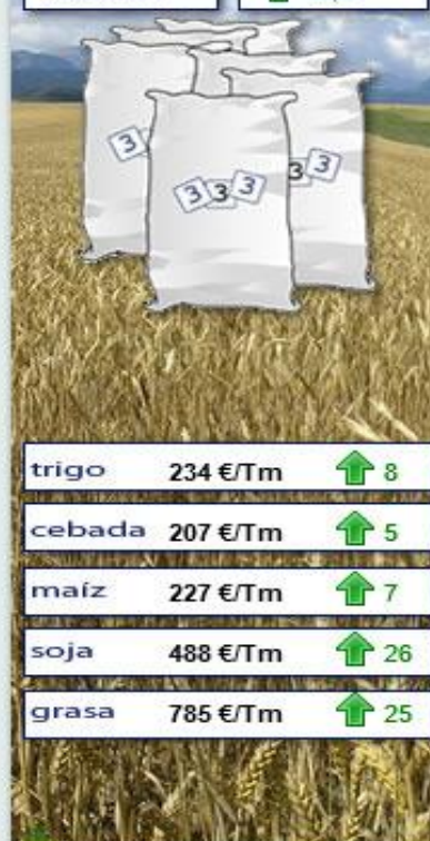
Evolución semanal durante los últimos 12 meses