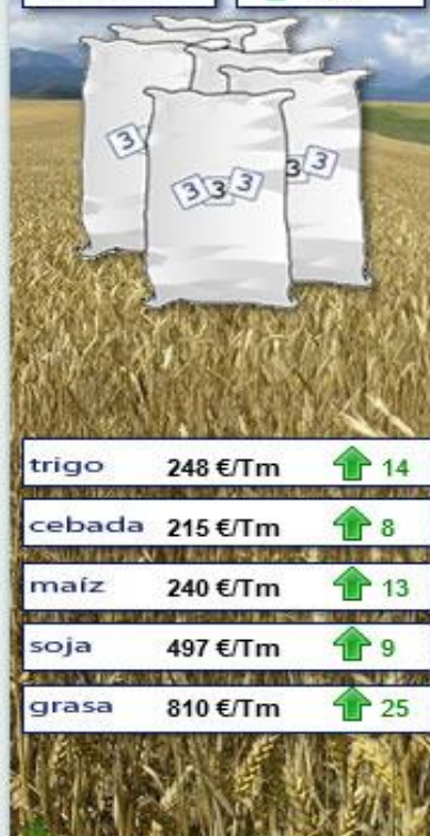
Evolución semanal durante los últimos 12 meses