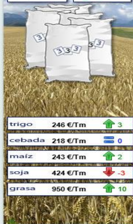
Evolución semanal durante los últimos 12 meses