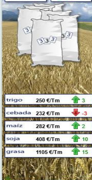
Evolución semanal durante los últimos 12 meses