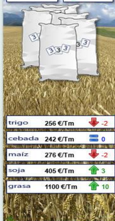
Evolución semanal durante los últimos 12 meses