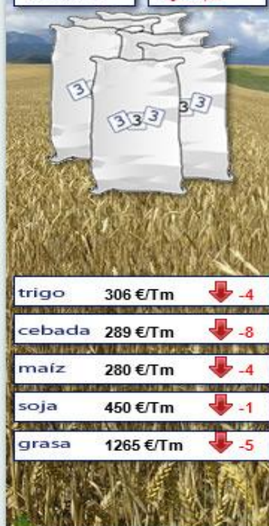
Evolución semanal durante los últimos 12 meses