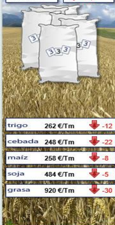
Evolución semanal durante los últimos 12 meses